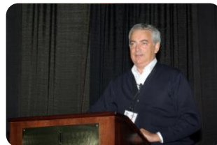
Καθ. Κλεομένης Μπάρλος

Η ζωή του νέου καινοτόμου επενδυτή γίνεται μετά βεβαιότητας πιο ενδιαφέρουσα, σε περίπτωση δε επιτυχίας της προσπάθειάς του, εκτοξεύεται ταυτόχρονα και η ποιότητάς της.