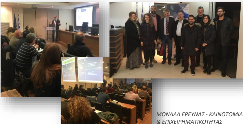
ΜΟΝΑΔΑ ΕΡΕΥΝΑΣ - ΚΑΙΝΟΤΟΜΙΑΣ & ΕΠΙΧΕΙΡΗΜΑΤΙΚΟΤΗΤΑΣ